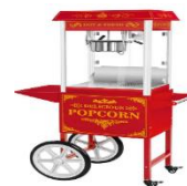
Adquirido un nuevo Palomitero