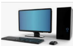
Conseguido la donación (RICOMS) de 3 ordenadores para el colegio