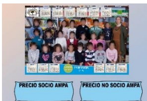
Organizado Orlas y Foto-CALENDARIOS