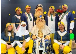
Organizado "Cartero Real 2019"