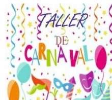
Organizado el divertido "Taller de Carnaval 2020"